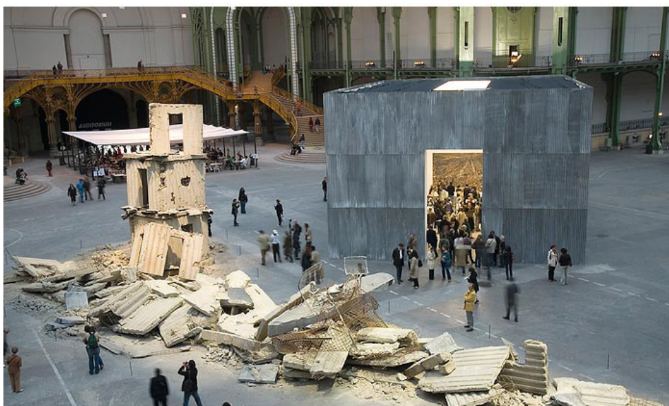
Monumenta 2007, Anselm Kiefer Chute d'étoiles Sternenfall

« Ce titre comprend la naissance et la mort de l'univers avec toutes ces étoiles qui naissent et meurent chaque jour comme des êtres humains...Et quand une étoile meurt, elle explose, elle devient incandescente, blanche et elle explose en envoyant toutes sortes de débris et de poussières dans l'univers à des distances inimaginables. Et puis cette matière se rassemble, coagule et forme de nouveau une étoile, une au