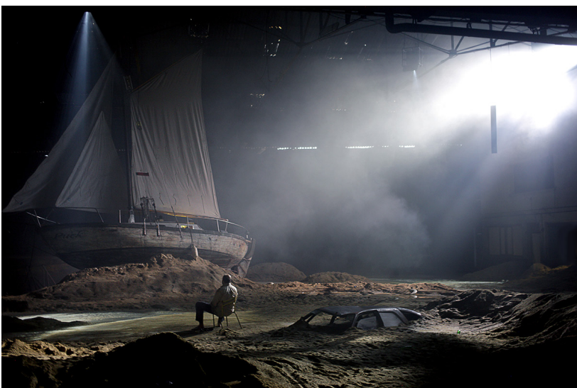
Les Naufragés

• Improvisation / Exercice d'écriture : donner la parole à un oublié en choisissant la forme adaptée (enregistrement, texte, jeu..)