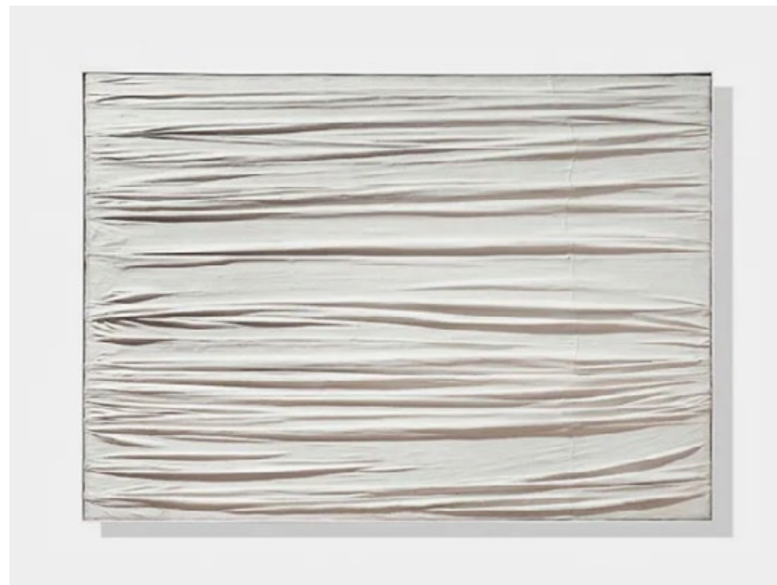
Achrome , Piero Manzoni (1933-1963)

Comment l'absence de couleur permet-elle de se focaliser sur la matière ou des plis ? Quels liens peut-on établir avec une zone blanche ?