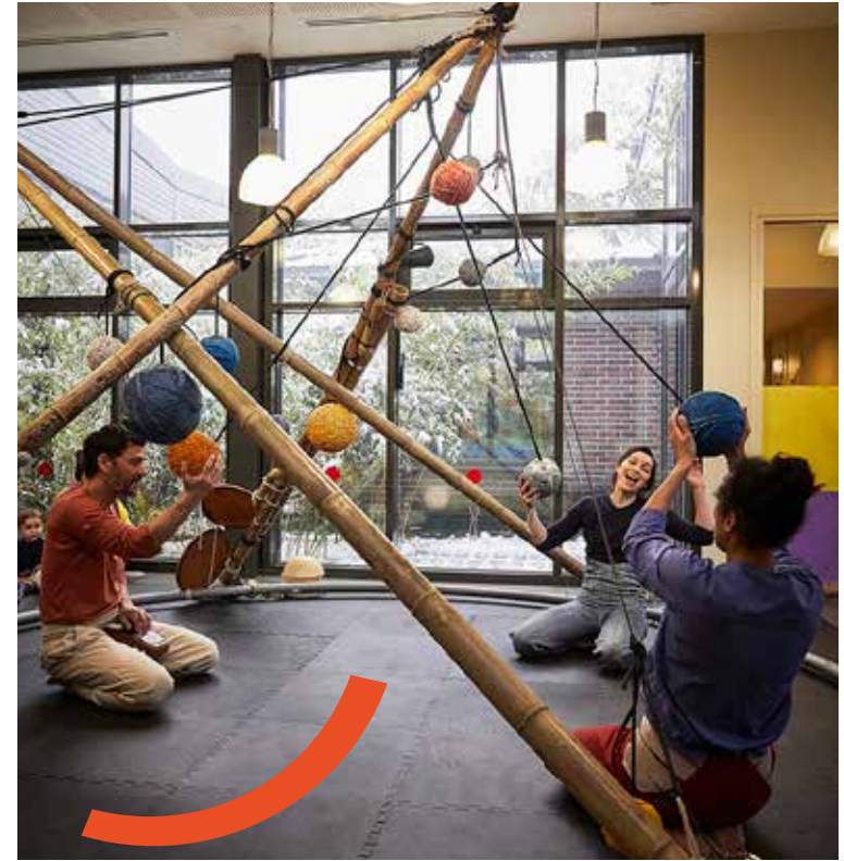
TEMPS DU SPECTACLE

Twinkle s'articule en deux temps complémentaires et indissociables . Le public, rassemblé en cercle autour d'une structure aérienne en bambous est tout d'abord spectateur , se laissant bercer et imprégner par les sons et mouvements d'une chanteuse, d'une acrobate aérienne et d'un musicien percussionniste.