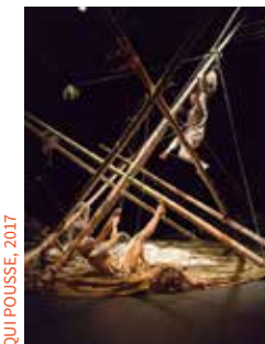
QUI POUSSE, 2017