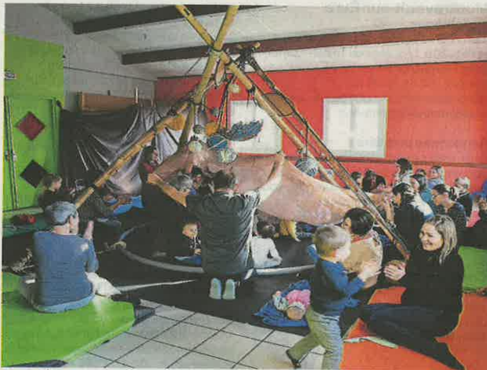
Du rythme tout en douceur pour réunir tout le monde dans la cabane improvisée.