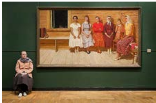
Guardians d'Andy Freeberg