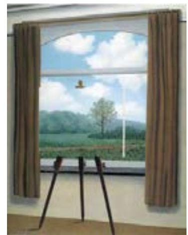
La Condition humaine , Magritte, 1935