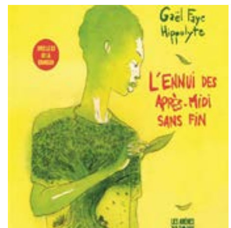
L'Ennui des après-midi sans fin , Gaël Faye, illustration par Hyppolite, 2020