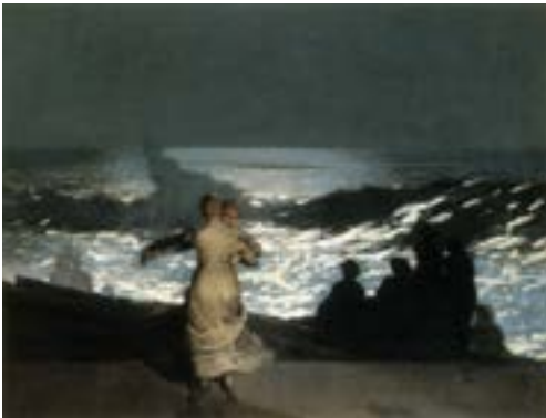
Nuit d'été , Homer Winslow, 1890, Musée d'Orsay, Paris

- Nuit d'été , Homer Winslow, 1890, Musée d'Orsay, Paris