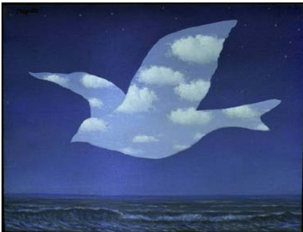
L'oiseau de ciel, Magritte