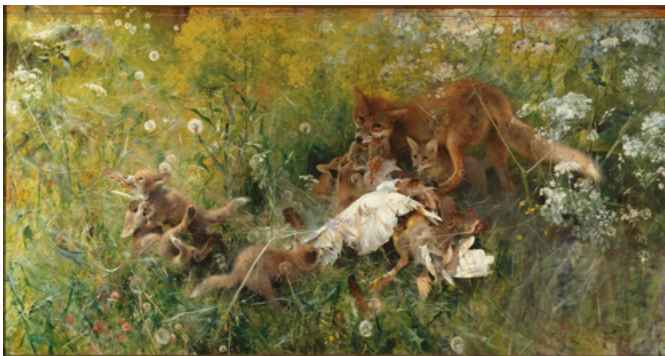
Famille de renards , par Bruno Liljefors, 1886, Nationalmuseum, Stockholm